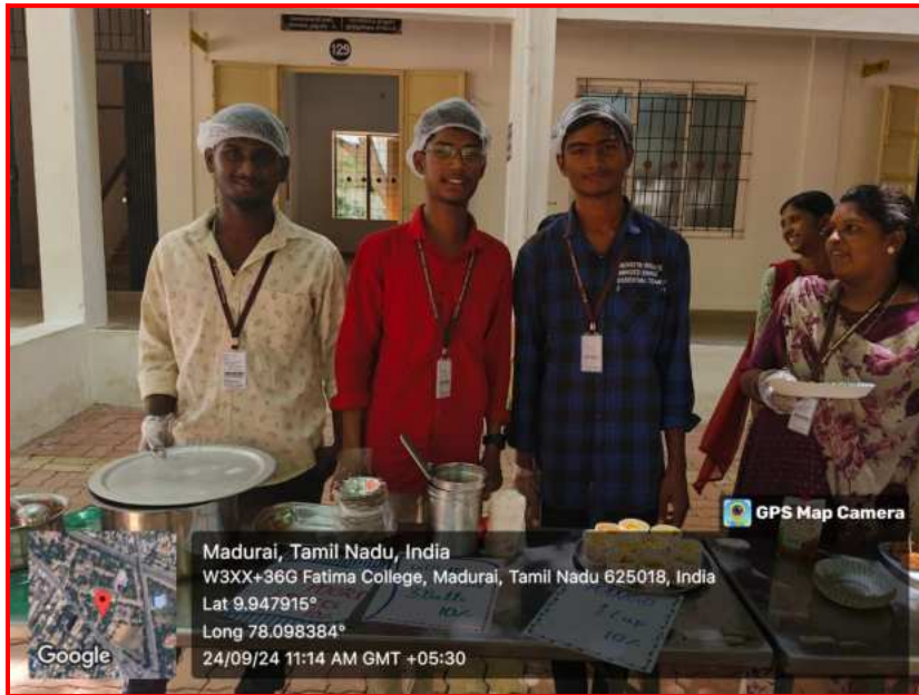
Traditional Food Expo on 24.09.2024